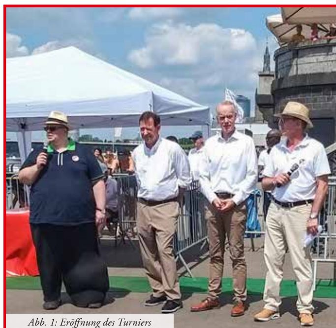
Abb. 1: Eröffnung des Turniers

In diesem Jahr nahmen fast 400 Jungen und Mädchen aus 12 Nationen am Turnier teil, wobei die Mädchen den größten Anteil ausmachten. Als Preis winkte für die Plätze eins bis drei einer jeden Gruppe ein Siegerpokal und eine Medaille.