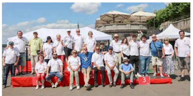
Ohne Ehrenamtliche geht es nicht: die Helfer